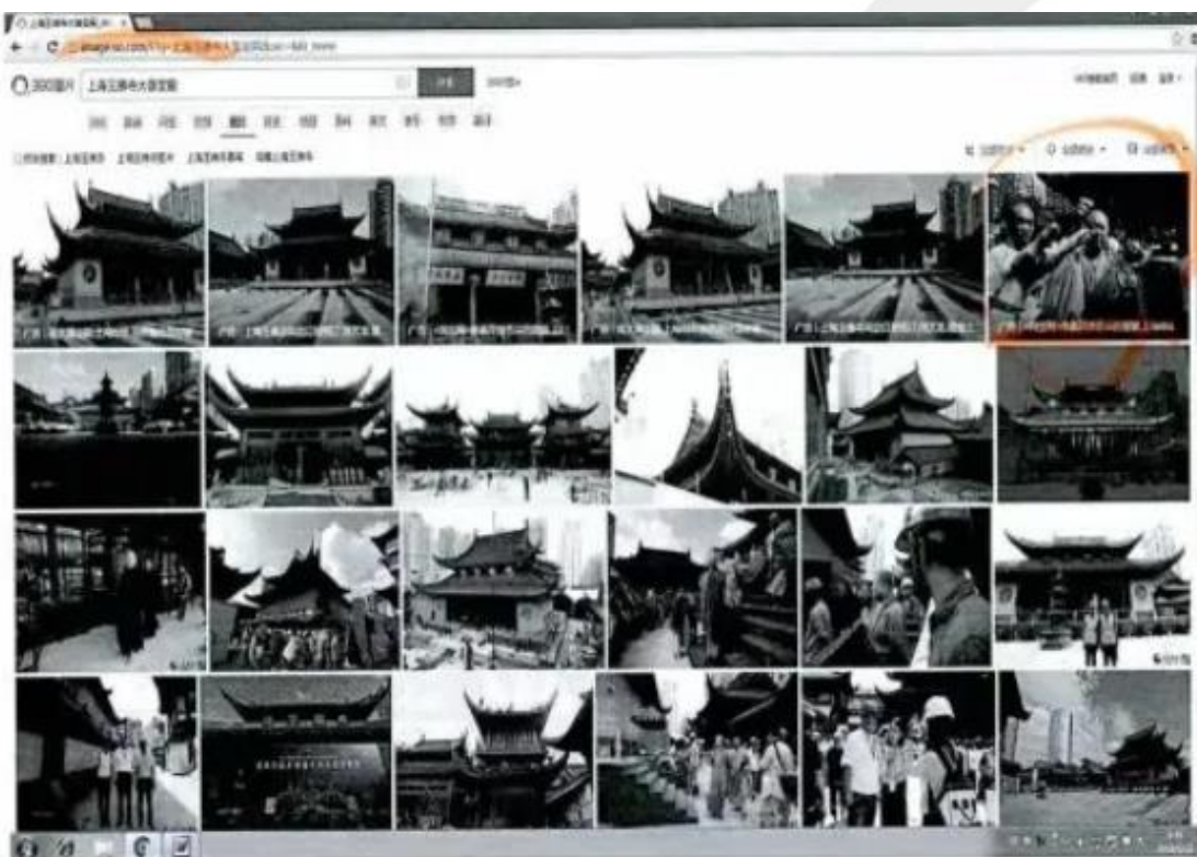
△ 360 图片搜索页面

陈某认为，奇虎公司和聚效公司提供涉案图片并使用该图片做广告的行为构成侵权，遂将奇虎公司与聚效公司诉至上海市浦东新区人民法院，请求法院判令奇虎公司和聚效公司连带赔偿经济损失 30 万元以及为诉讼维权支出的合理费用 4 万余元，并在官方网站刊登道歉声明。奇虎公司提供证据证明 360 图片搜索结果中部分图片上有“广告”字样，但上述图片仍属于缩略图，点击图片网页会直接跳转至广告所对应的第三方网站，是因为缩略图上覆盖透明广告图层（浮层），缩略图与广告链接（浮层）是两个部分，在图片上设置图层的行不构成信息网络传播侵权。